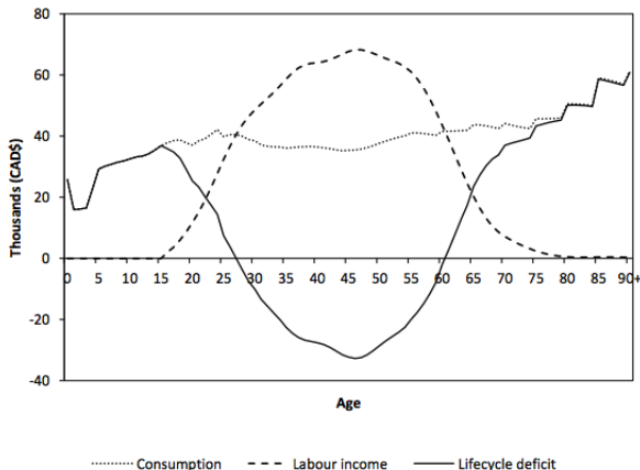
Figure C. Per capita lifecycle deficit in Canada for 2013

Figure – Mérette M., Navaux J. (2019), "Population aging in Canada : What the lifecycle deficit profiles are telling us about living standards?", Canadian Public Policy .